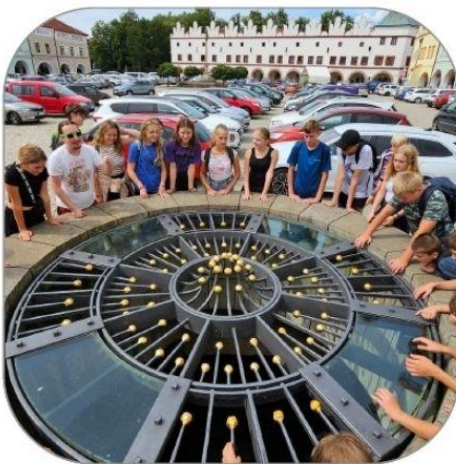
LETNÍ KOMENTOVANÉ PROHLÍDKY MĚSTA