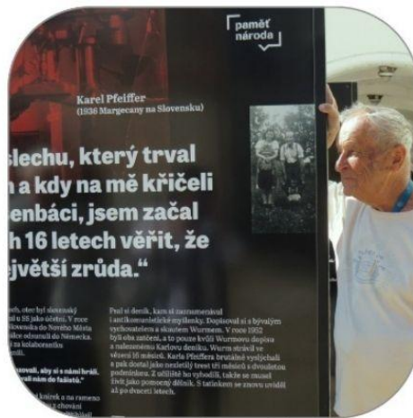
VÝSTAVA PĚTILETKA BĚSŮ