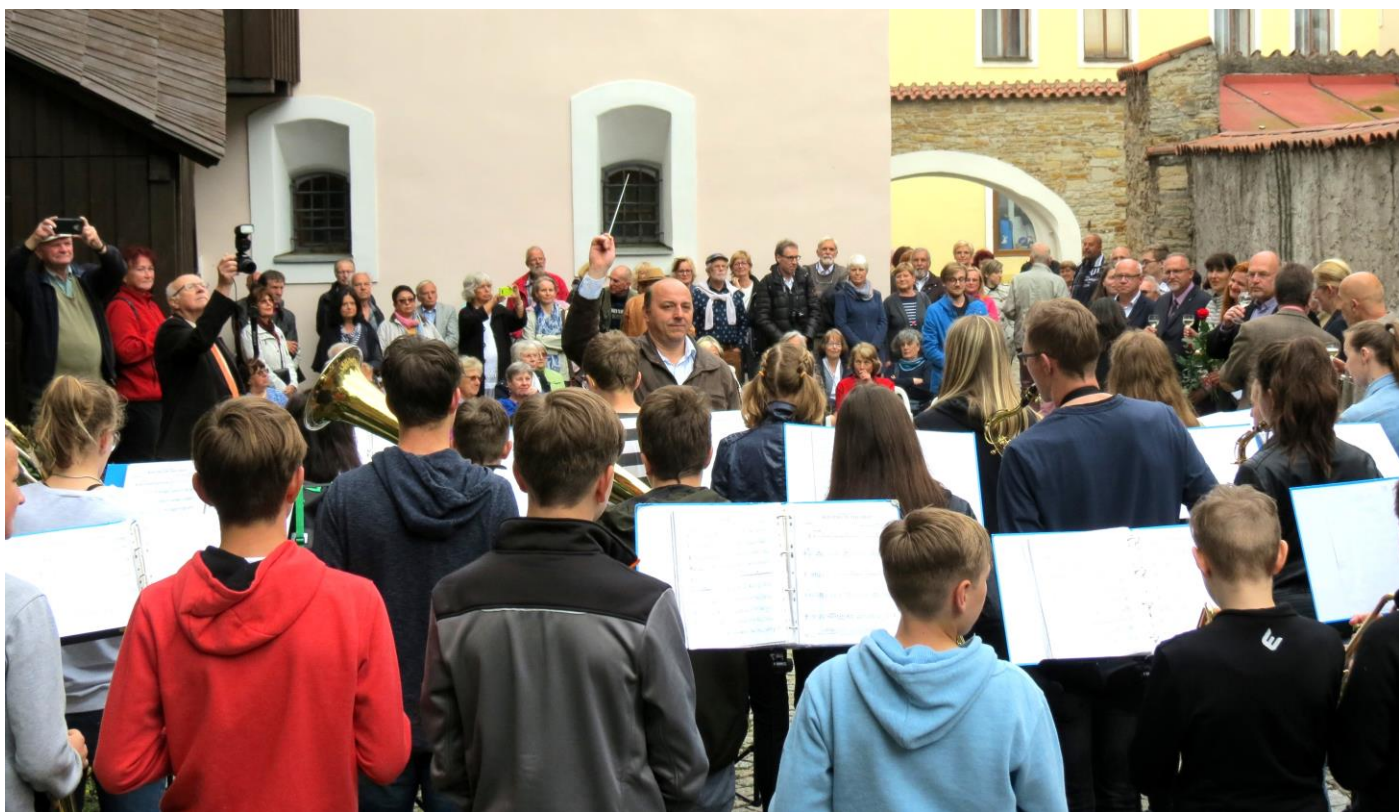
Vernisáž výstavy Hilden H6 v Městské galerii Zázvorka