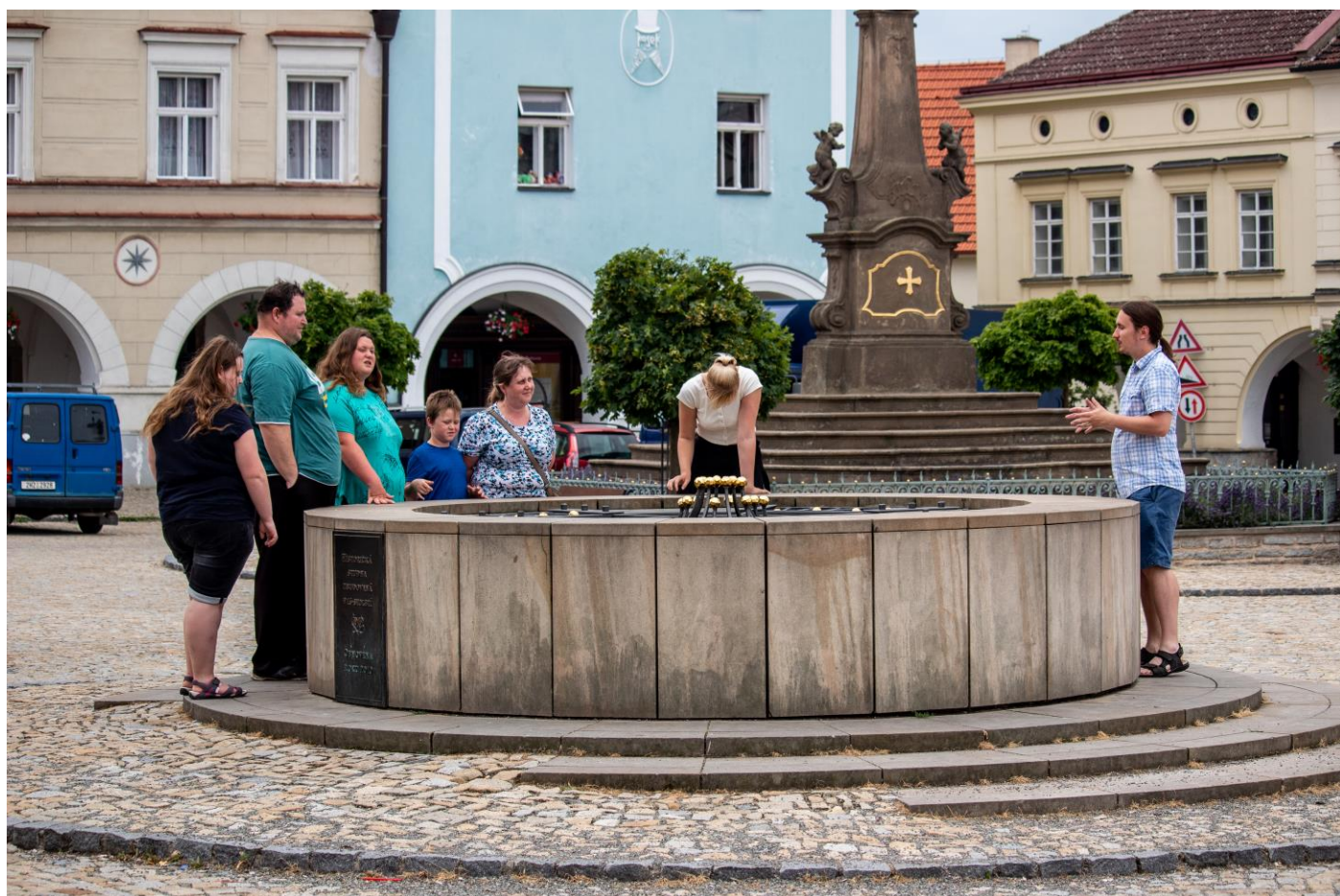
Prázdninové pondělní komentované prohlídky města