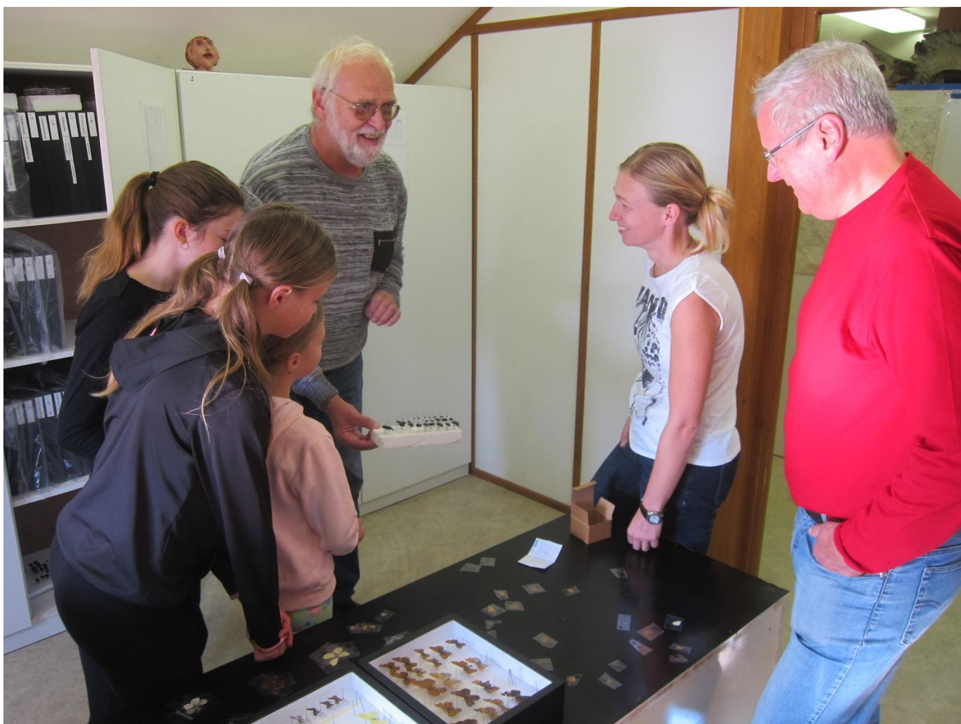
Z činnosti přírodovědného oddělení - spolupráce se ZŠ Malecí