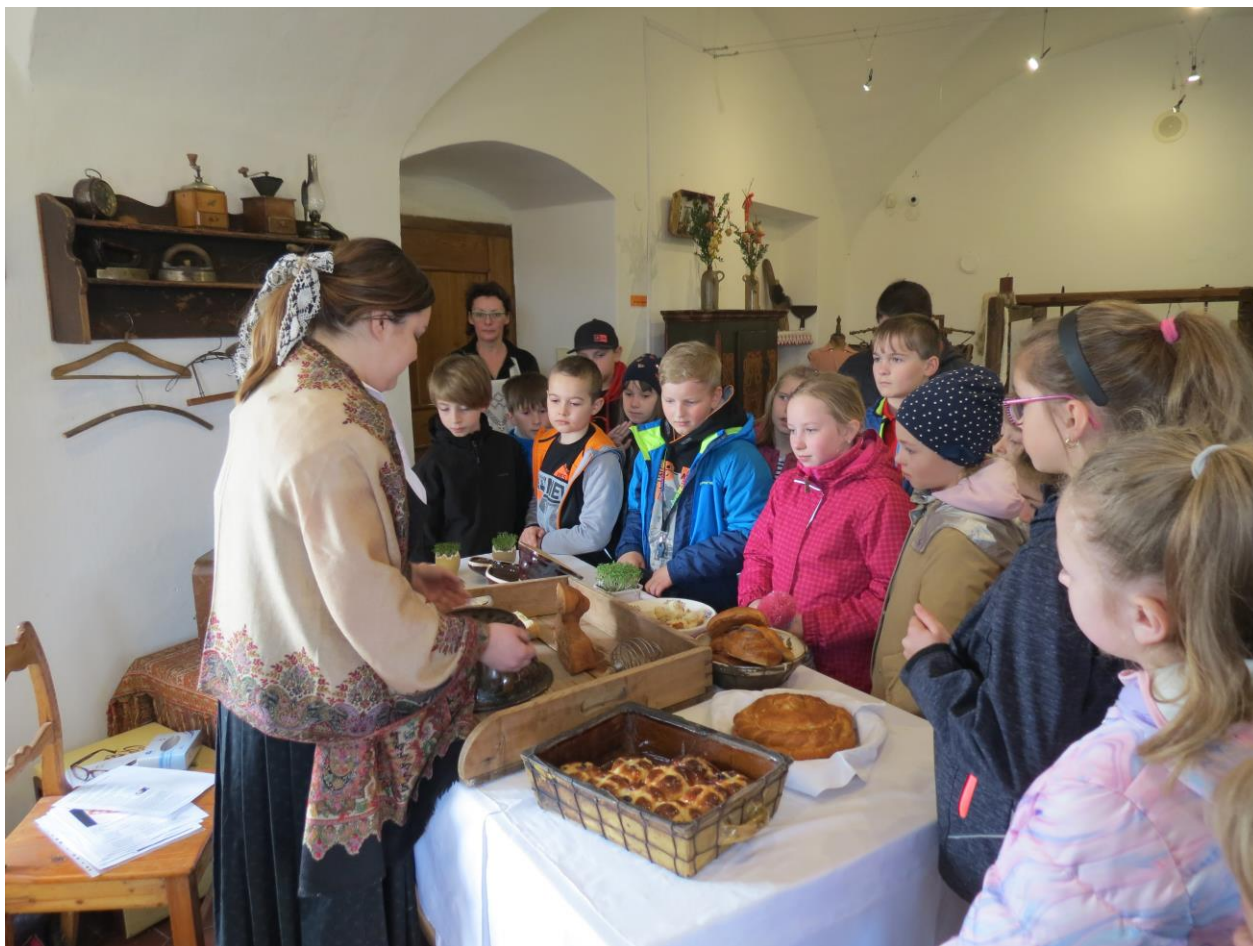
Muzejní týden pro školy