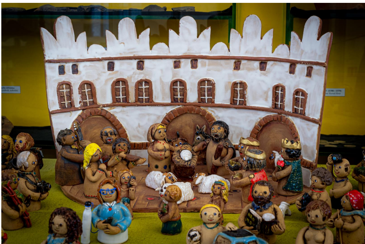
Výstava Betlémy a Vánoce v muzeu