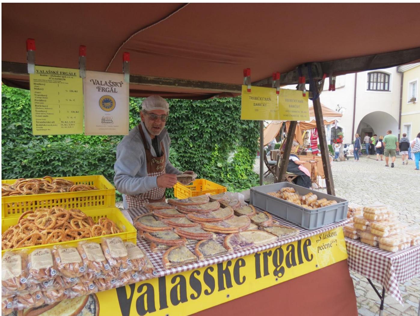
Muzejní staročeské trhy