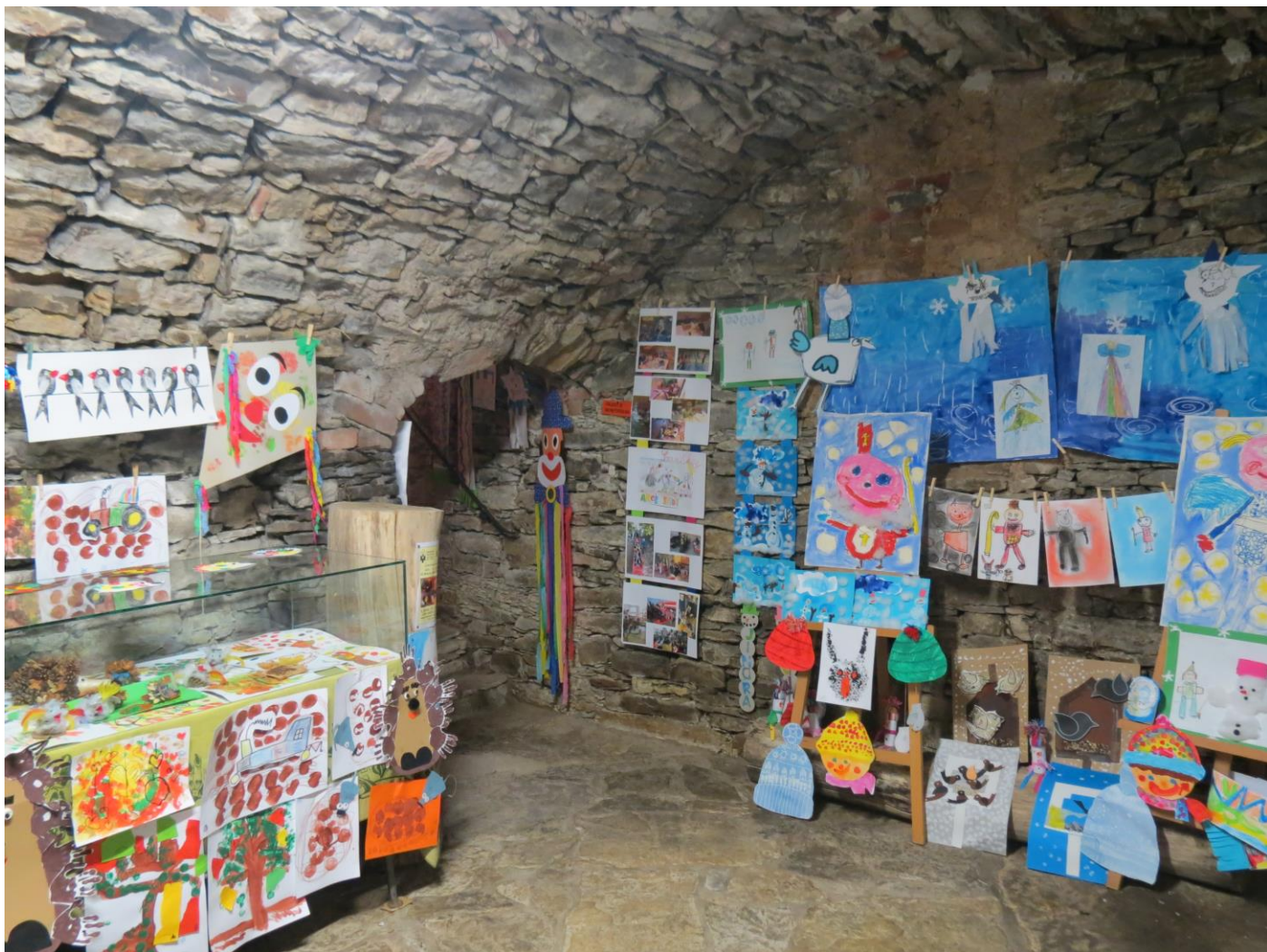
Výstava Jaro, léto, podzim, zima – ve školce je nám vždy prima ve sklepení Spolkového domu