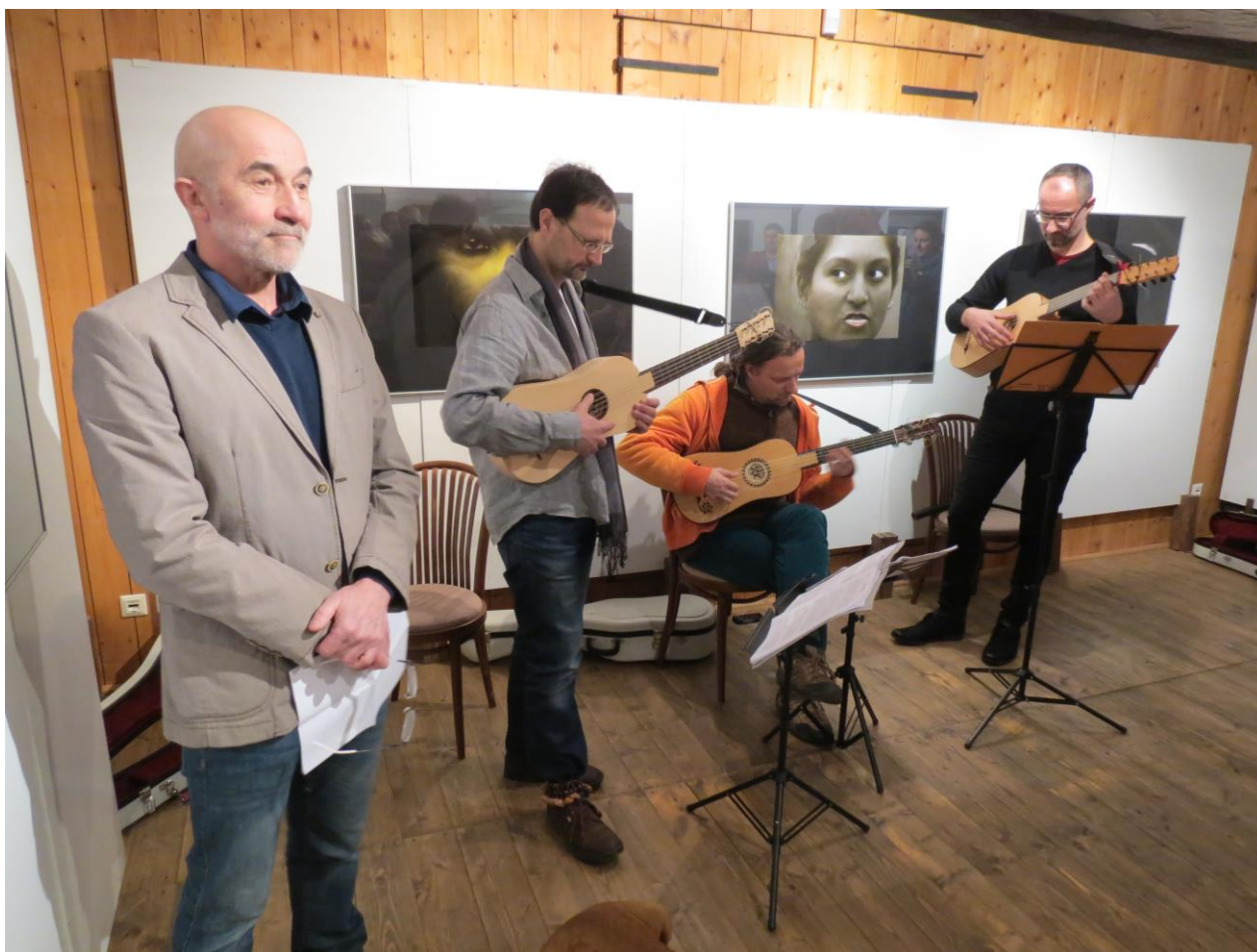
Vernisáž výstavy 5+1 Kam až... v Městské galerii Zázvorka