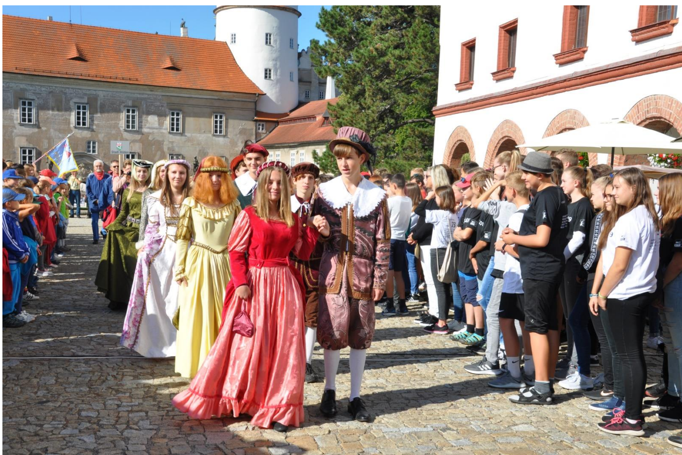
Dny evropského dědictví