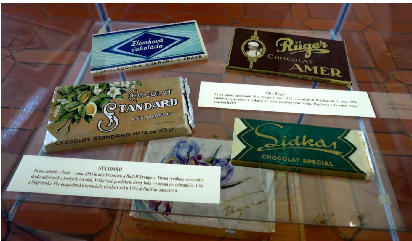
Výstava Kouzelný svět čokolády