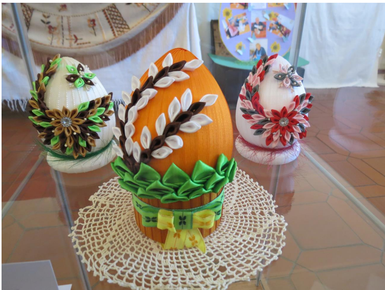
Výstava Velikonoce v muzeu