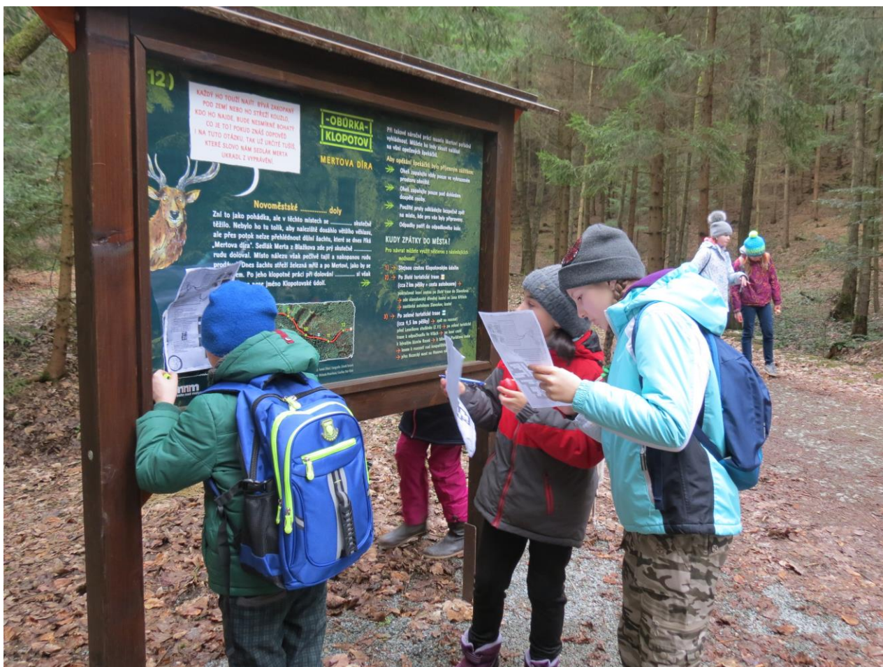
Testování Questu v Obůrce Klopotov (ZŠ Krčín + pracovníci IC)