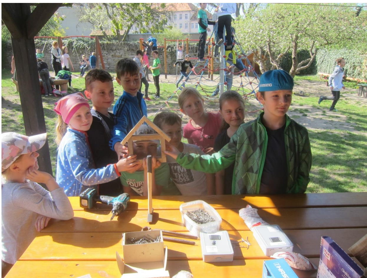
Přírodovědná gramotnost – výroba hmyzích domečků