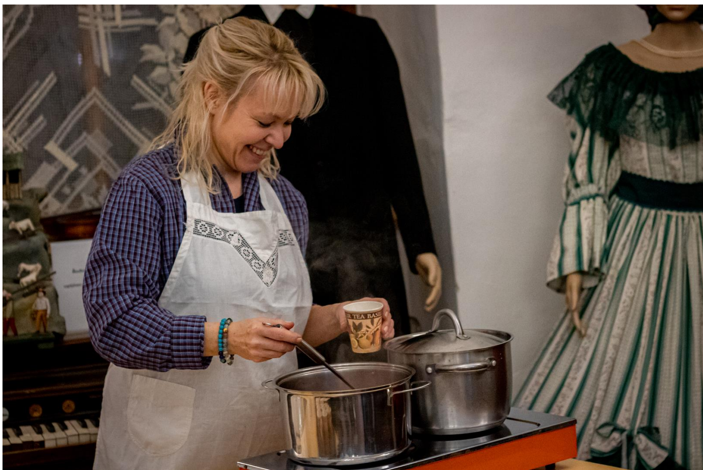
Adventní muzejní noc