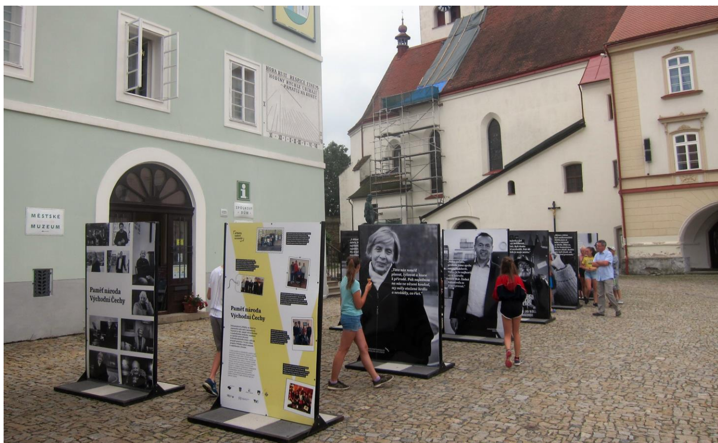
Výstava Paměť národa Východní Čechy před Spolkovým domem