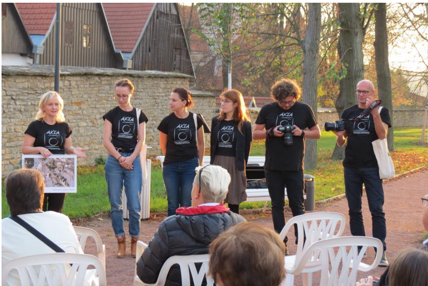
Vernisáž výstavy Inspirace přírodou v Městské galerii Zázvorka