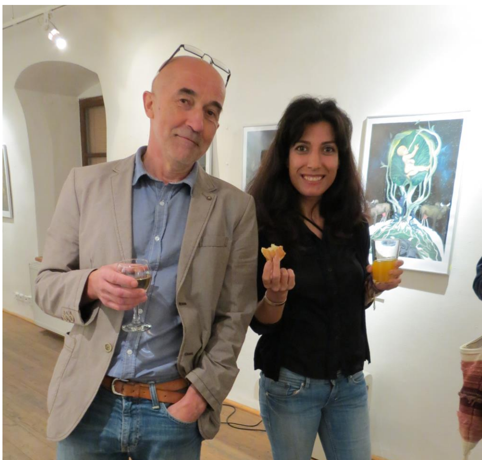
Vernisáž výstavy Íránské mýty