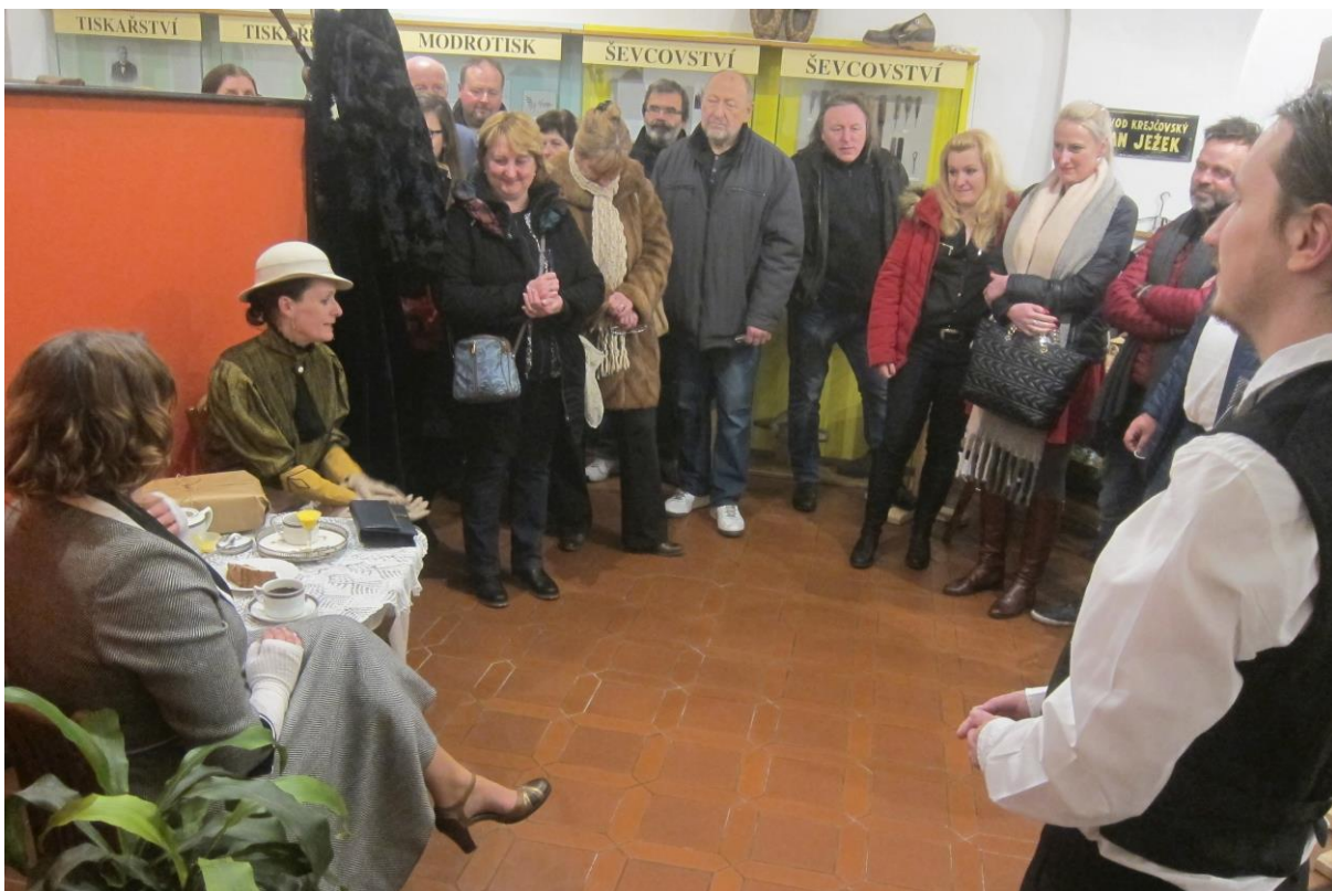
Vánoční muzejní noc v Městském muzeu