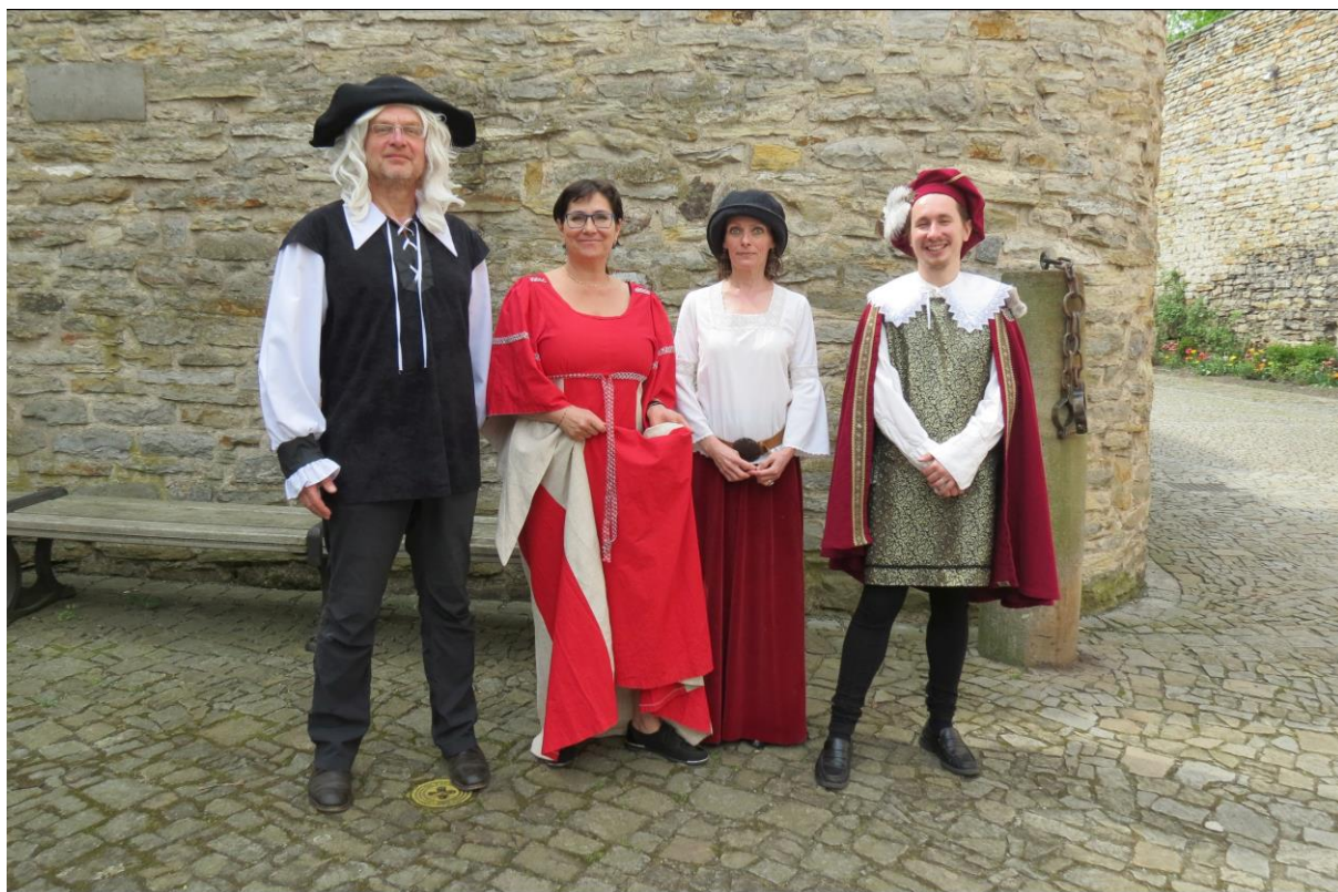
Muzejní týden pro školy – pracovníci muzea v dobových kostýmech