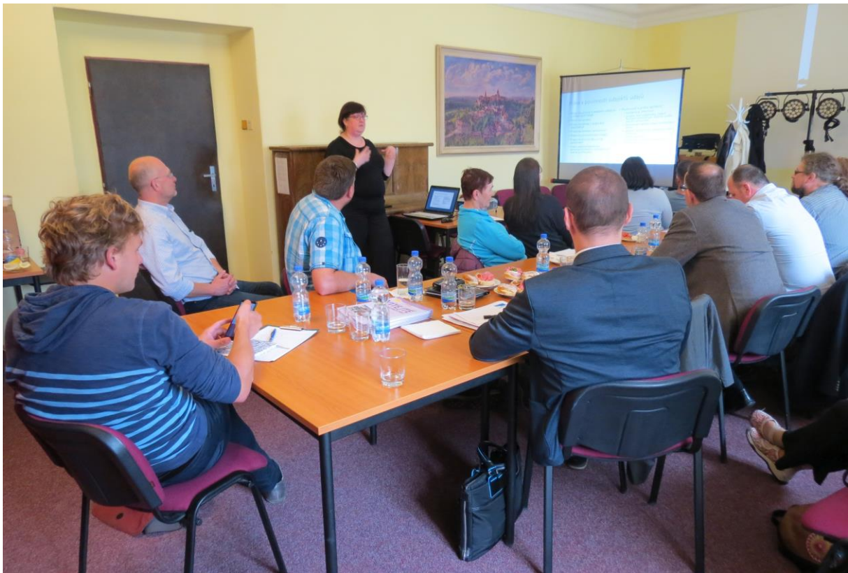
Jednání královéhradecké krajské sekce Asociace muzeí a galerií ve Spolkovém domě