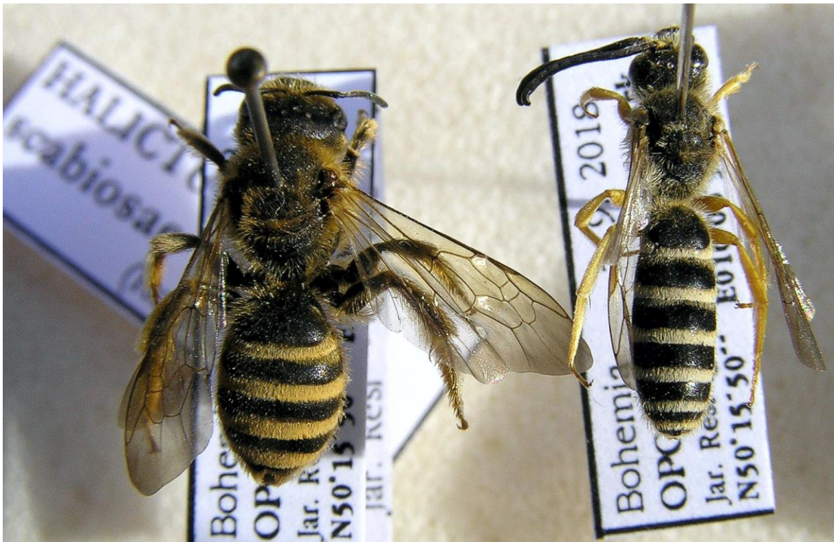
Z činnosti přírodovědného oddělení - invazní druh včely Halictus scabiosae nalezený při průzkumu v Zámeckém parku v Opočně