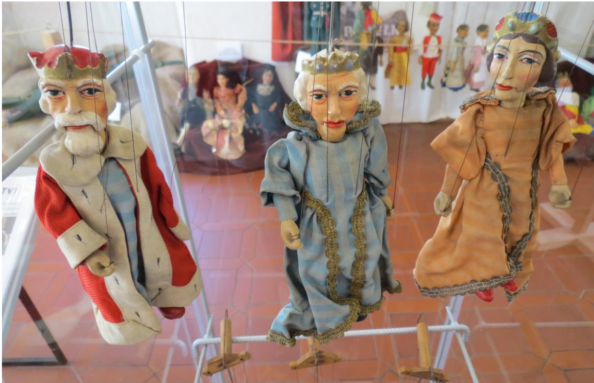
Výstava Svět loutek v historickém sále Městského muzea