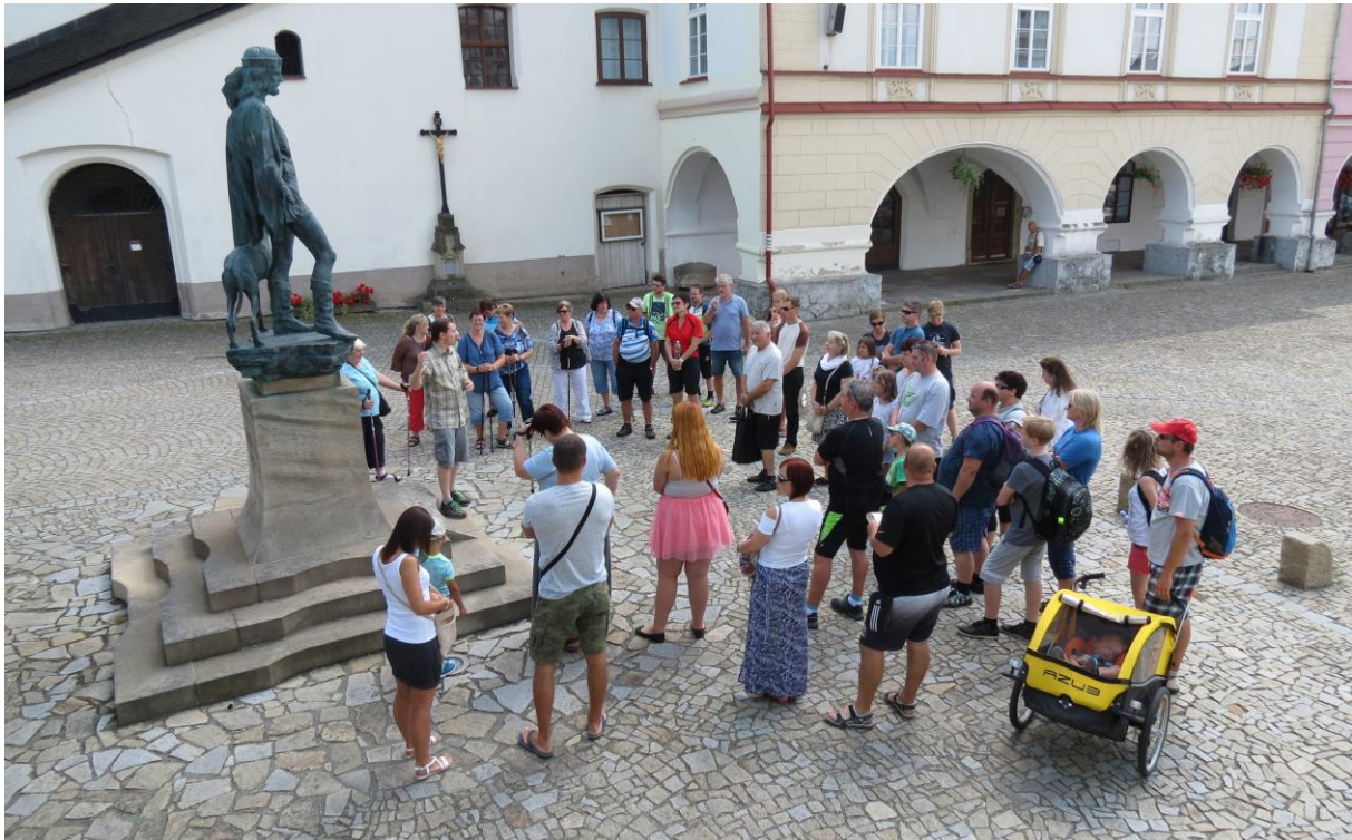
Prázdninové pondělní komentované prohlídky historického centra města