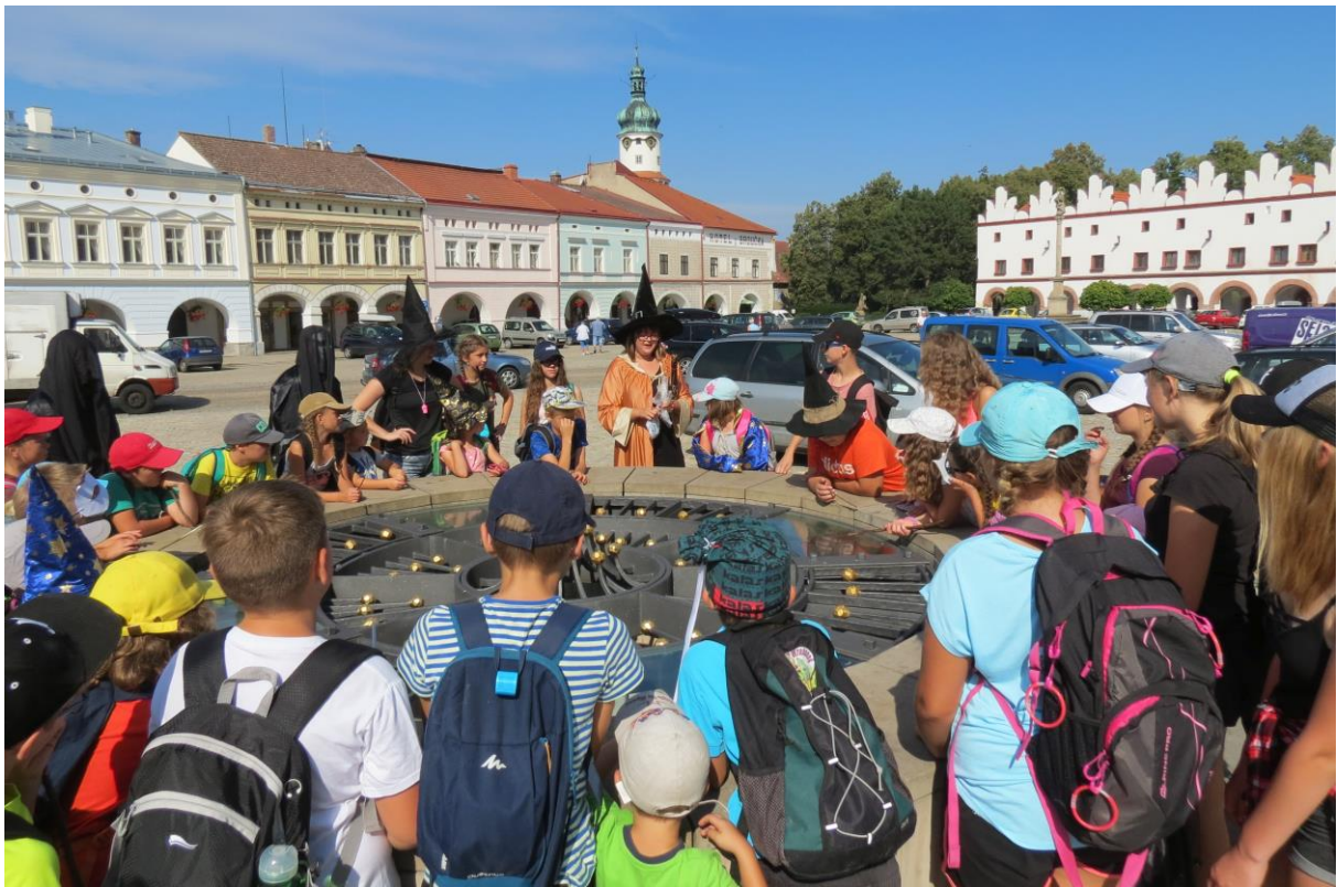
Kouzelnická prohlídka Husova náměstí pro příměstský tábor