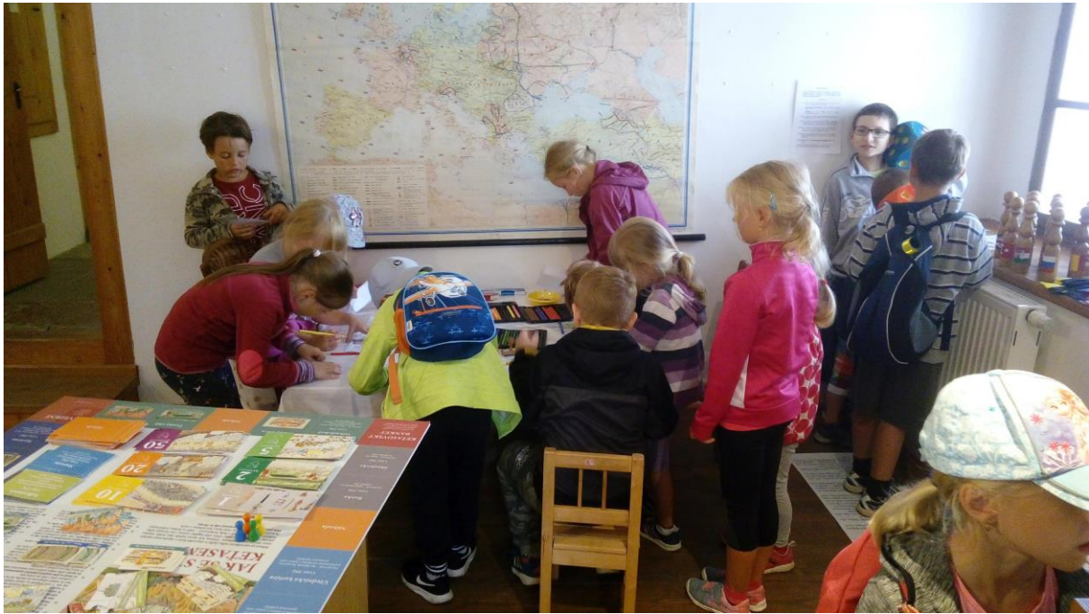
Interaktivní výstava Zmatené peníze v Městské galerii Zázvorka