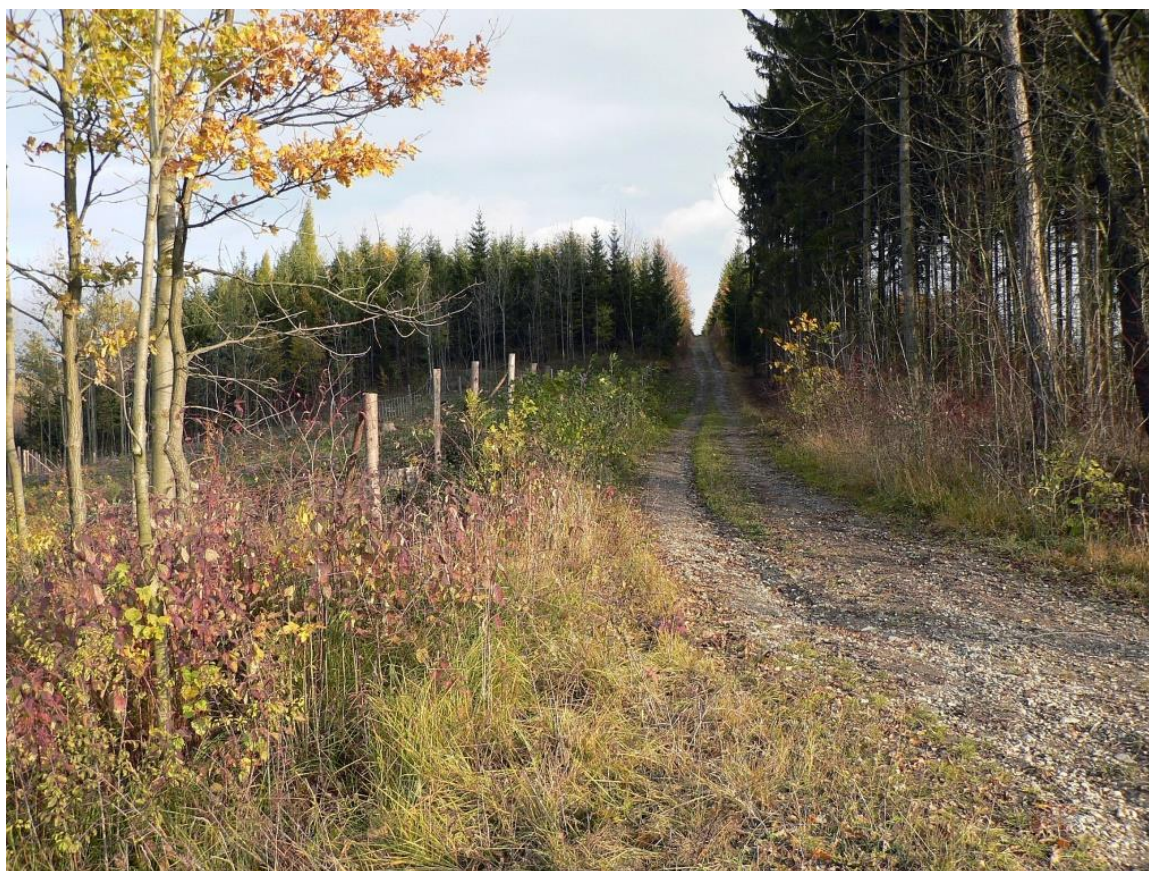
Pohled na centrální část lokality Chlum u Dobrušky.