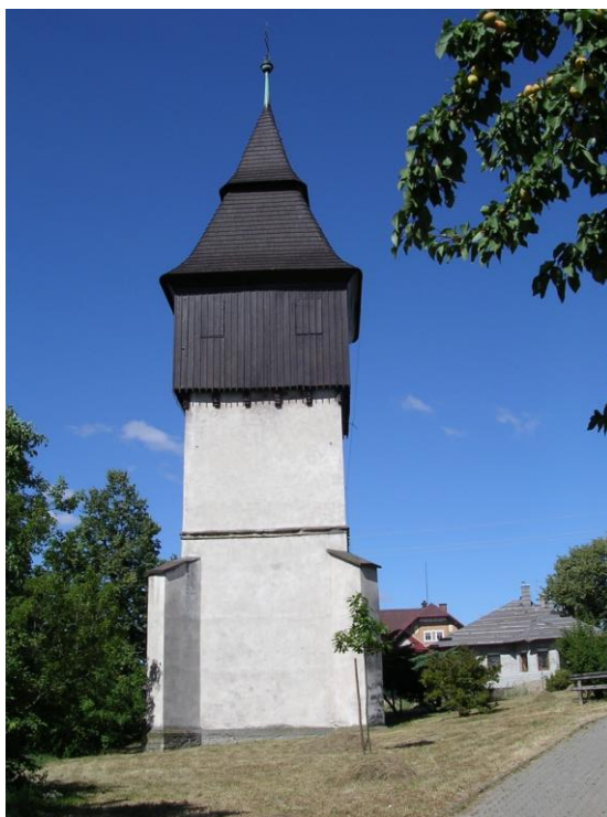
Krčinská polozděná zvonice.